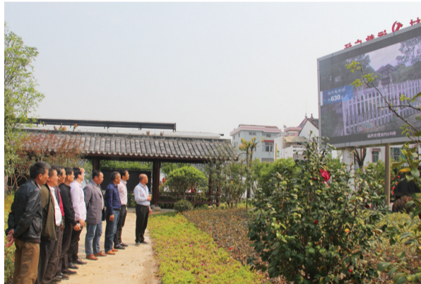
图为培训小组现场观看城乡生活污水治理宣教片

为普及生活污水运维知识，提高运维人员专业技能，4月26日，排水公司联合安昌街道在盛陵村开展了生活污水运维技能比武暨宣传活动。