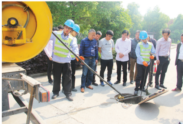
图为冲洗小组现场进行管网冲洗